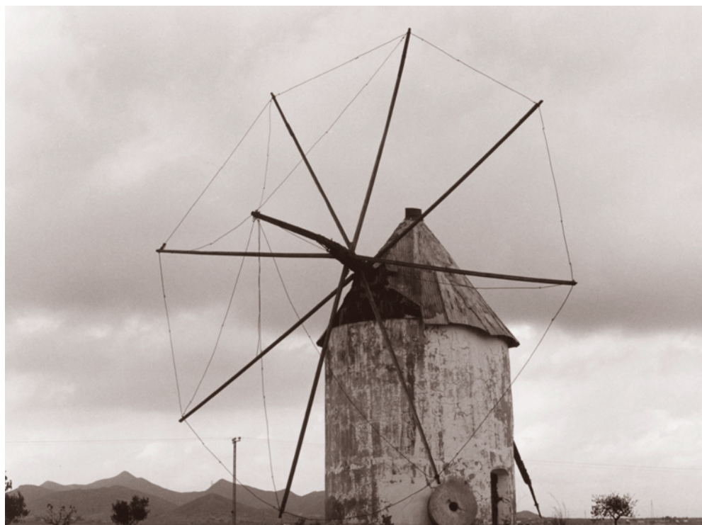
MOLINO JARAPA (INFERIOR)