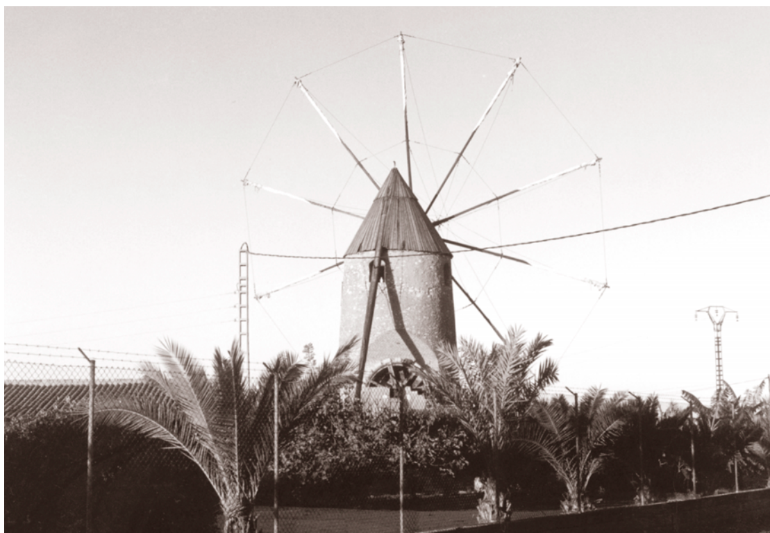
MOLINO DE LUENGO

rios, que lo desmontó por decreto. Así, nada se avanzó hasta la llegada de la II República, que en 1932 decidió introducir el procedimiento clave de la fotografía aérea. A partir de 1960 se inició la elaboración de un nuevo catastro, elaborado a base de aquel sistema a escala de 1:10.000 e incluso menor, consiguiendo una notable precisión, aunque aún queda bastante por hacer.